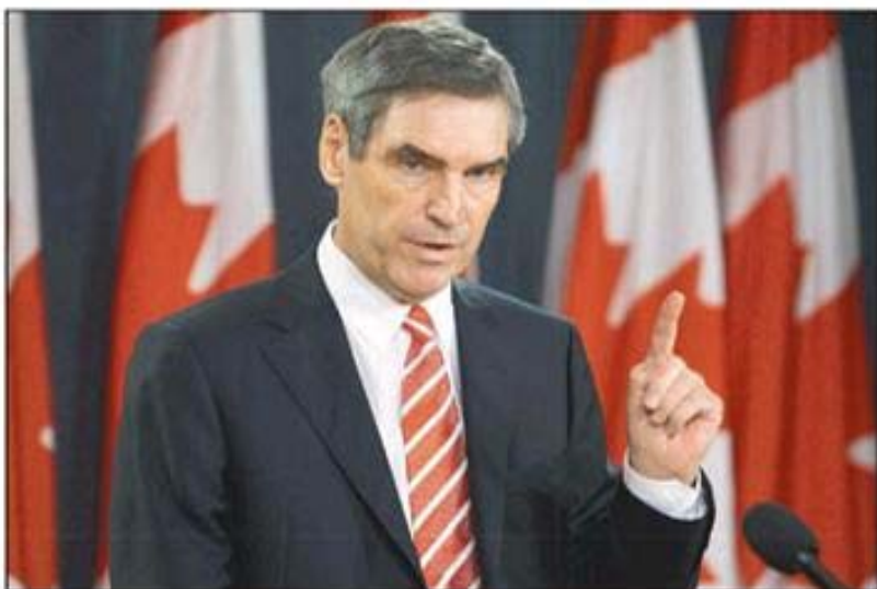
自由黨黨魁葉禮庭有條件支持保守黨的新預算，提出政府要定期提供預算執行報告。